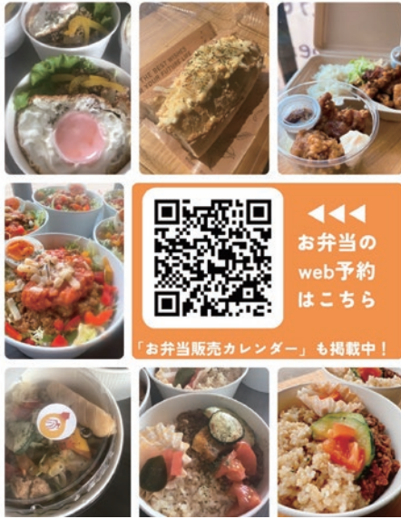
▼まるフェのお弁当

まるフェ館林はランチタイムに近隣の市役所などへ移動販売に伺っています。このたび、お弁当の事前予約がwebからお受けできるようになりました！役所にお勤めの方はもちろん、一般の方でもご予約、ご購入頂けます。現在定期的に販売しているのは古河市役所、佐野市役所、加須市役所、加須市北川辺総合支所などです。お近くの販売場所へまるフェが伺う時はぜひご利用ください。数に限りはありますがご予約なしでも購入して頂けます。まるフェのお弁当の輪が広がっていきますね😊（館林・諏訪）