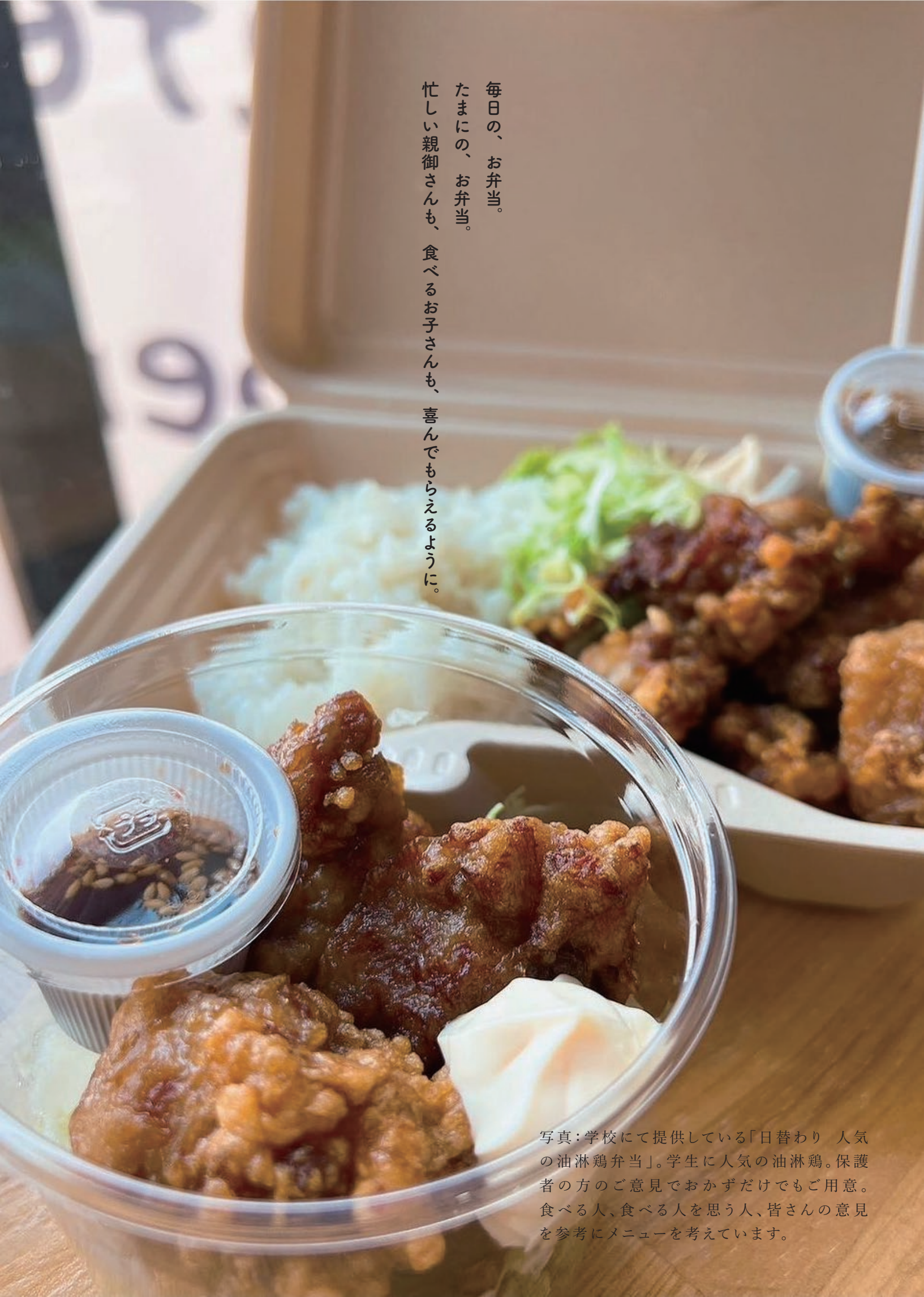
写真：学校にて提供している「日替わり 人気の油淋鶏弁当」。学生に人気の油淋鶏。保護者の方のご意見をおかずだけでもご用意。食べる人、食べる人を思う人、皆さんの意見を参考にメニューを考えています。

毎日の、お弁当。 たまにの、お弁当。 忙しい親御さんも、 食べるお子さんも、 喜んでもらえるように。