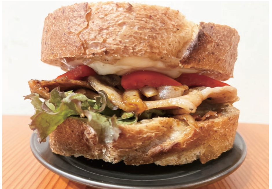
▲阿波踊り大会にエールを！