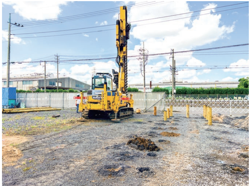
▲老人ホーム 設計完了～着工

cm／長さ4～5mの木杭を地面に差し込む 地盤改良を行っています。木材は雨がかり や湿気の多い場所にあるとすぐに腐朽し ますが、水中や酸素濃度の低い場所では 腐朽の進行が遅くなり数十年・数百年経 つても耐力上問題なく使えるそうです。 気になって調べてみると、水の都として有 名なヴェネチアも同じように、水辺の建物 の基礎下に木杭を打ち込んでいるとか。 鉄やRCによる杭の開発が一九〇〇年前半 なので単純に木材しかなかったのかわし れませんが、今でも現存していると言 う点に安心感があります。(設計・安藤)